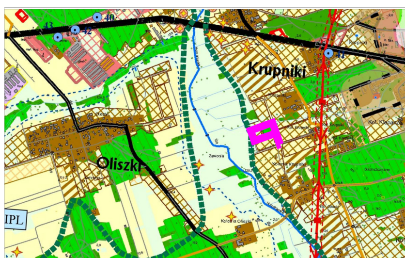
KIERUNKI ZAGOSPODAROWANIA PRZESTRZENNEGO