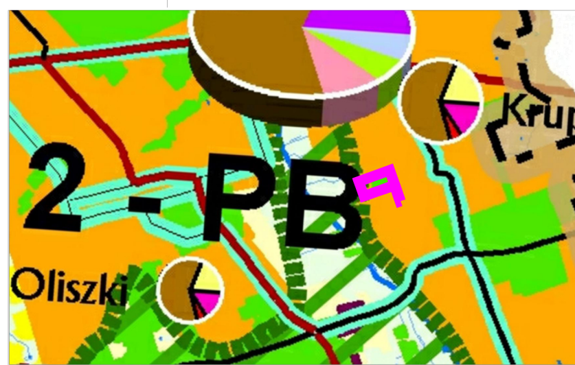
KIERUNKI KSZTAŁTOWANIA STRUKTURY PRZESTRZENNEJ OBSZARÓW FUNKCYJNALNYCH