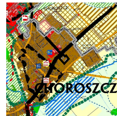
Kierunki zagospodarowania przestrzennego