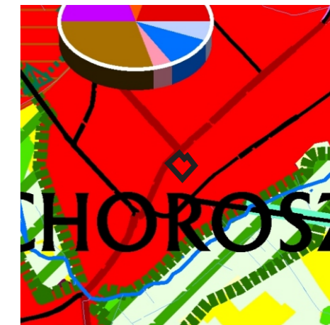
Kierunki kształtowania struktury przestrzennej obszarów funkcjonalnych

granica obszaru objętego zmianą planu miejscowego