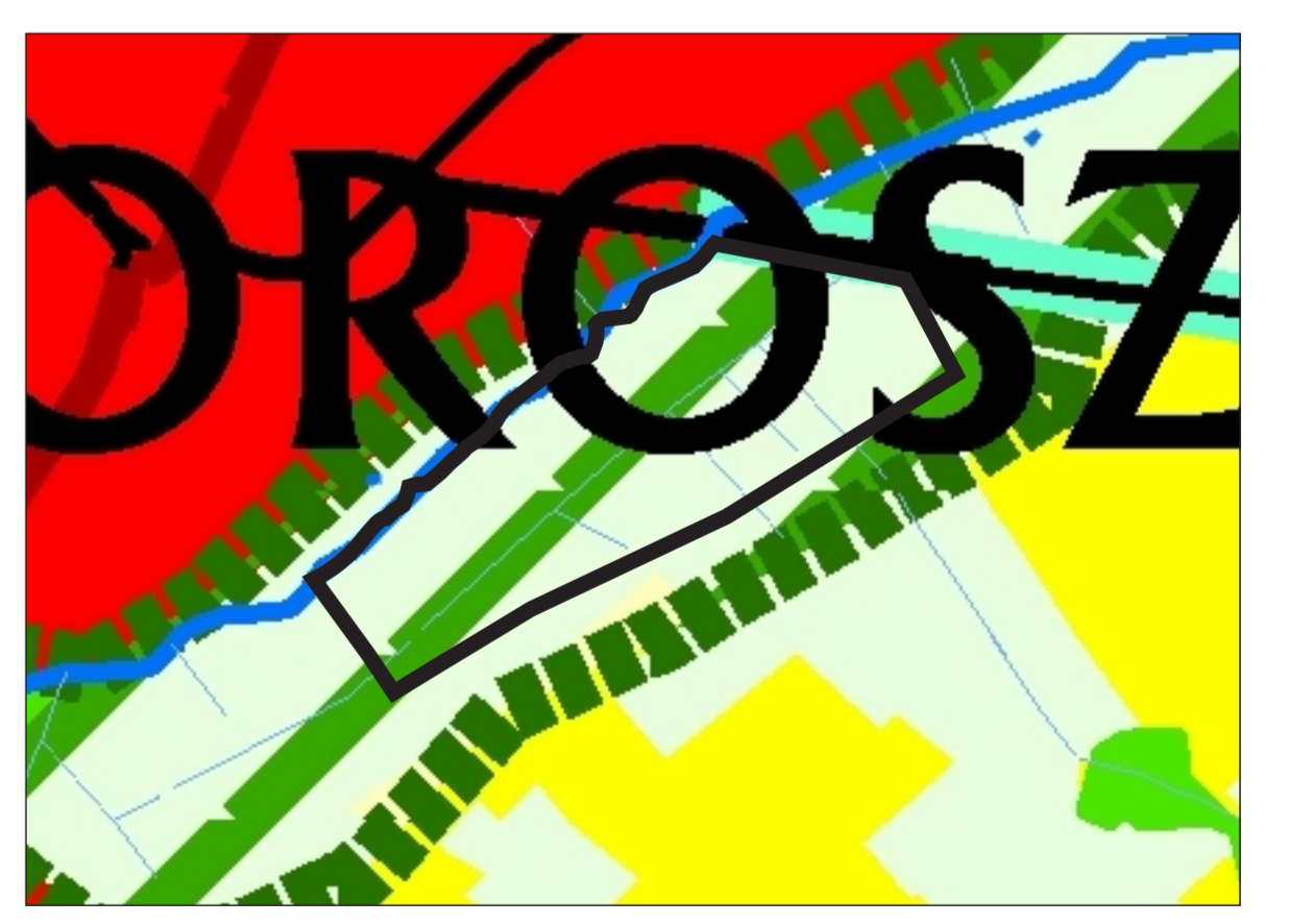
— granica obszaru objętego zmianą planu miejscowego Kierunki zagospodarowania przestrzennego Kierunki kształtowania struktury przestrzennej obszarów funkcjonalnych Wyrys ze studium uwarunkowań i kierunków zagospodarowania przestrzennego gminy Choroszcz Skala 1: 25 000