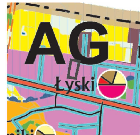
Kierunki kształtowania struktury przestrzennej obszarów funkcjonalnych

— granica obszaru objętego zmianą planu miejscowego