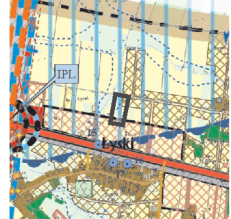
Kierunki zagospodarowania przestrzennego