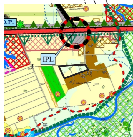
Kierunki zagospodarowania przestrzennego

PODGiK w Białymstoku 15-213 Białystok, Mickiewicza 3 tel./fax (085) 7439-421 www.podgik.bialystok.pl podgik_bialystok@poczta.onet.pl